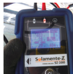
インピーダンス測定