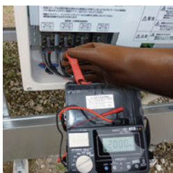
絶縁抵抗・接地抵抗の測定